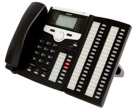
CTS-220.CL / 220.IP z konsolą CTS-338

Profil telefonu jest tworzony i przechowywany w pamięci centrali Slican dlatego z telefonu można korzystać natychmiast po włączeniu go do sieci, bez skomplikowanego i czasochłonnego programowania. Programowalne przyciski BLF pozwalają na indywidualne kreowanie funkcji, usług, czy też tworzenie listy podręcznych kontaktów. Dla wygody i zwiększenia liczby przycisków szybkiego wyboru, użytkownik może podłączyć do telefonu systemowego serii CTS-220 do 4 konsol Slican CTS-338, zwiększając ilość programowalnych przycisków do 160.