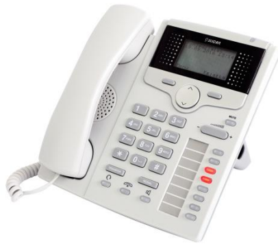
CTS-220.CL / 220.IP